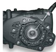
Induktiver Näherungssensor zur Drehzahlüberwachung