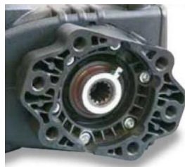
Mit Hohlwelle für Hydraulikmotor SAE C