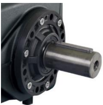
Freies Wellenende Ø 28 mm